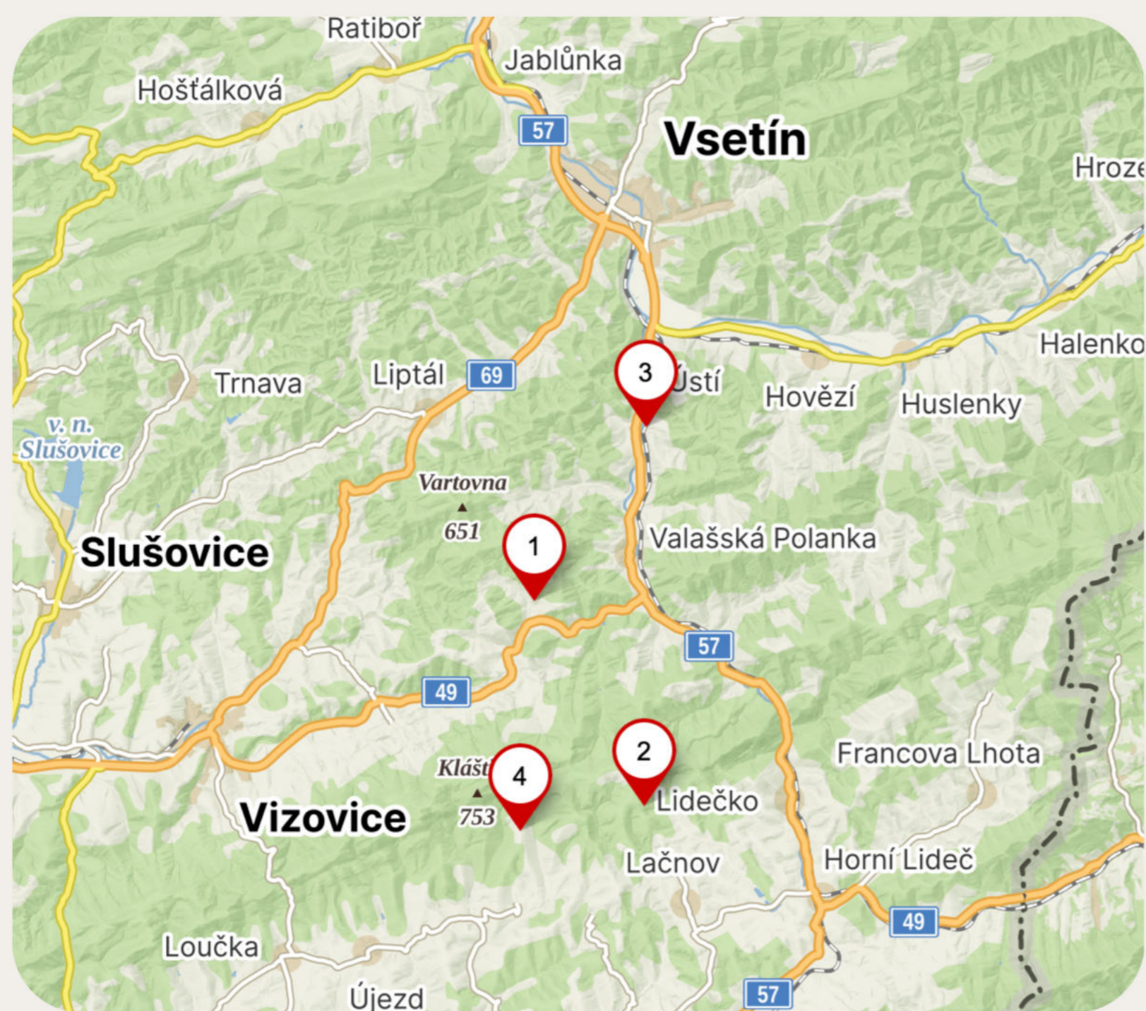
Mapa oblasti: 1 – Prlov; 2 – Vařákovy paseky; 3 – Leskovec (Juríčkův mlýn); 4 – Ploština

Obec Prlov na Valašsku se na konci druhé světové války stala terčem kruté nacistické odplaty za podporu partyzánského odboje. V pondělí 23. dubna 1945, jen pár dní před osvobozením oblasti Rudou armádou, byla vesnice obklíčena jednotkami SS a gestapa. Nacisté měli informace o partyzánech a hledali jejich spolupracovníky mezi obyvateli. Tato tragédie byla jednou z posledních represivních akcí nacistických jednotek na území protektorátu.