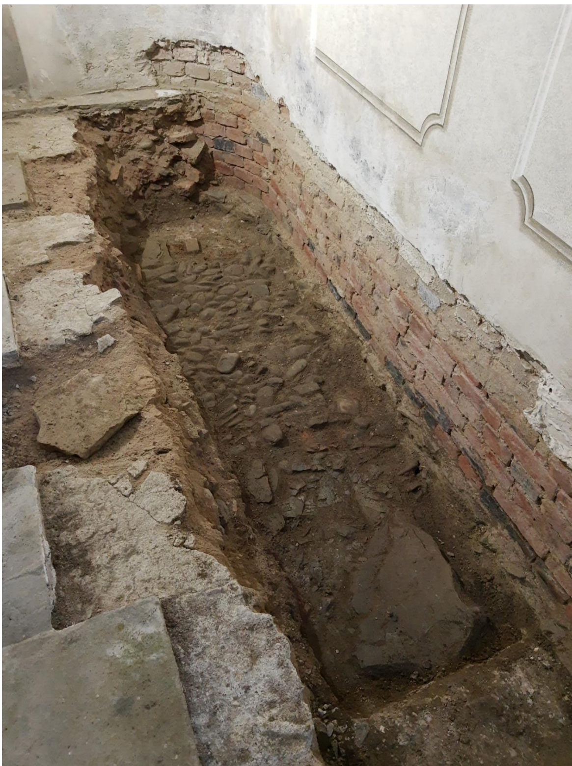
Obrázek 12 Odvodňování vnější stěny kaple, které prozatím brání jejímu úplnému otevření veřejnosti