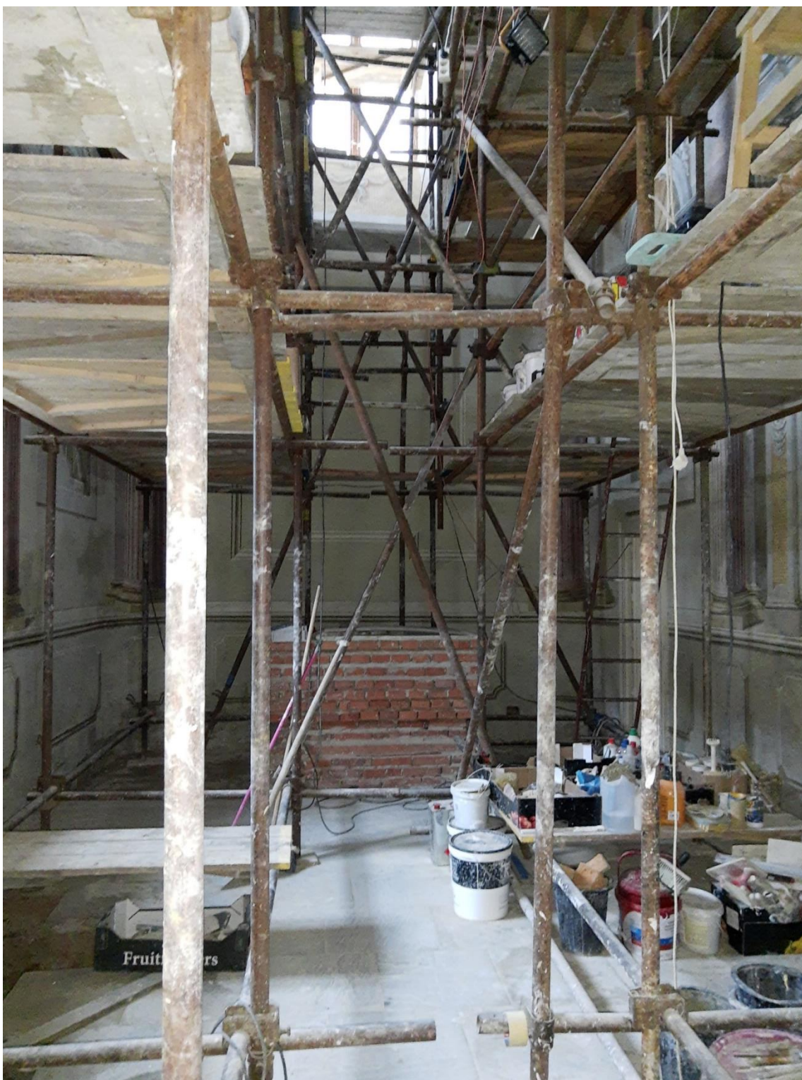
Obrázek 10 Práce na restaurování fresek