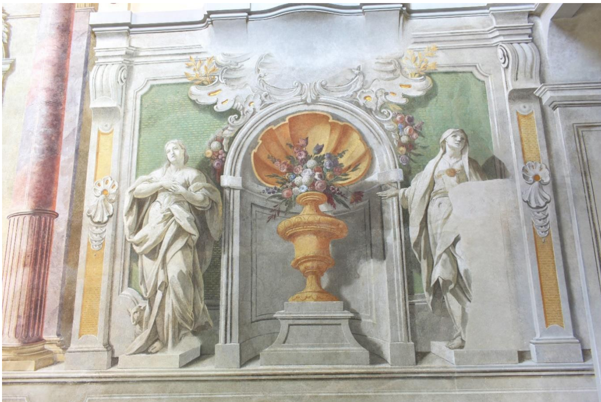
Obrázek 5 Ctnosti: nalevo Trpělivost s beránkem, jejíž tvář byla restaurátorkou domalována, napravo postava ctnosti bez dochovaného atributu s originální tváří od J. I. Sadlera