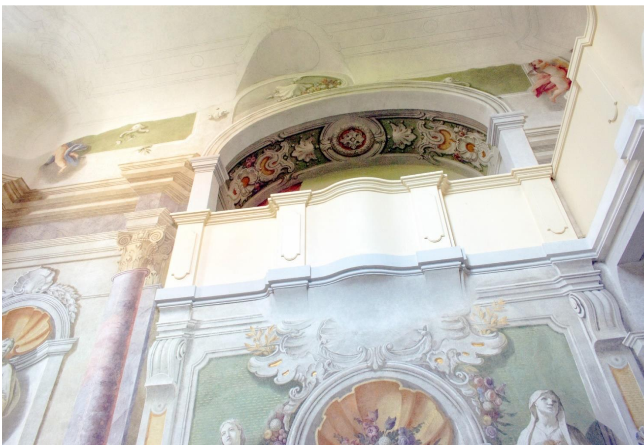
Obrázek 9 Vrchnostenská oratoř s bohatou výmalbou, napravo kruchta