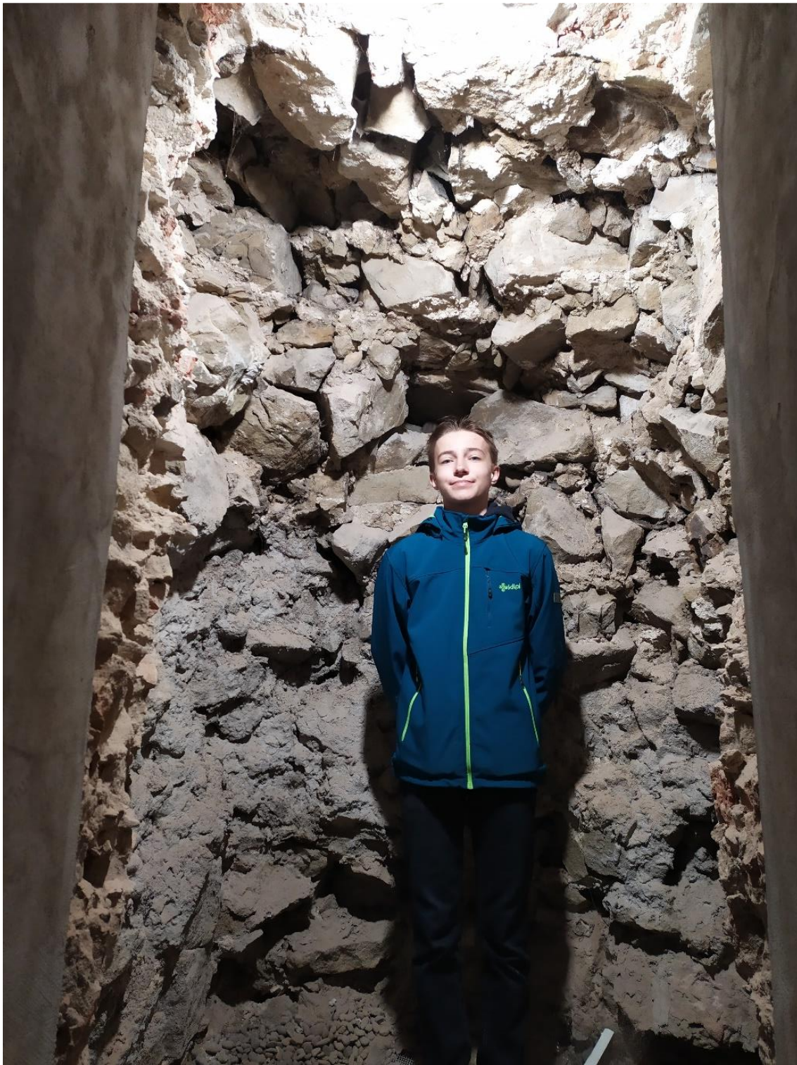
Obrázek 17 Autor v sakristii kaple se vstupem do malé dochované části meziříčských hradeb