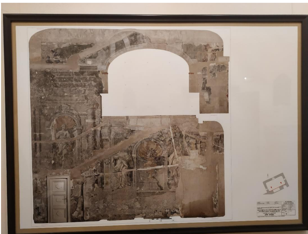
Obrázek 16 Ukázka fotogrammetrie zámecké kaple, která sdružením fotografií daného objektu zcela přesně zaznamená jeho prostorové uspořádání