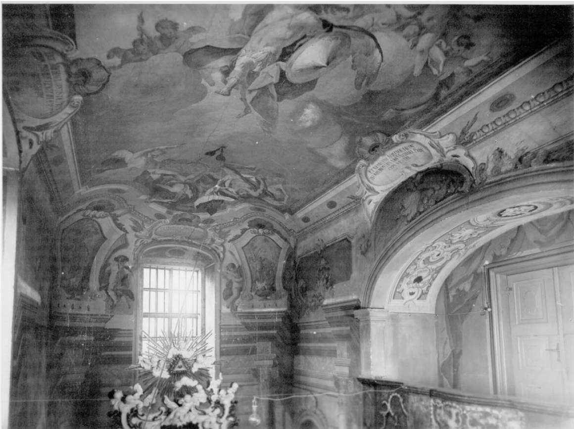
Obrázek 3 Stropní klenba s kartušemi a freskou archanděla Michaela