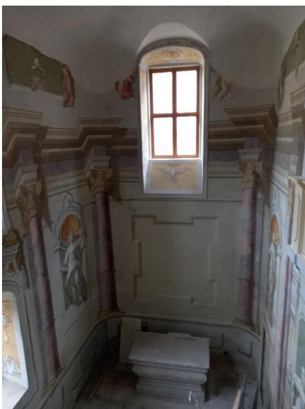
Obrázek 2 Kaple dnes