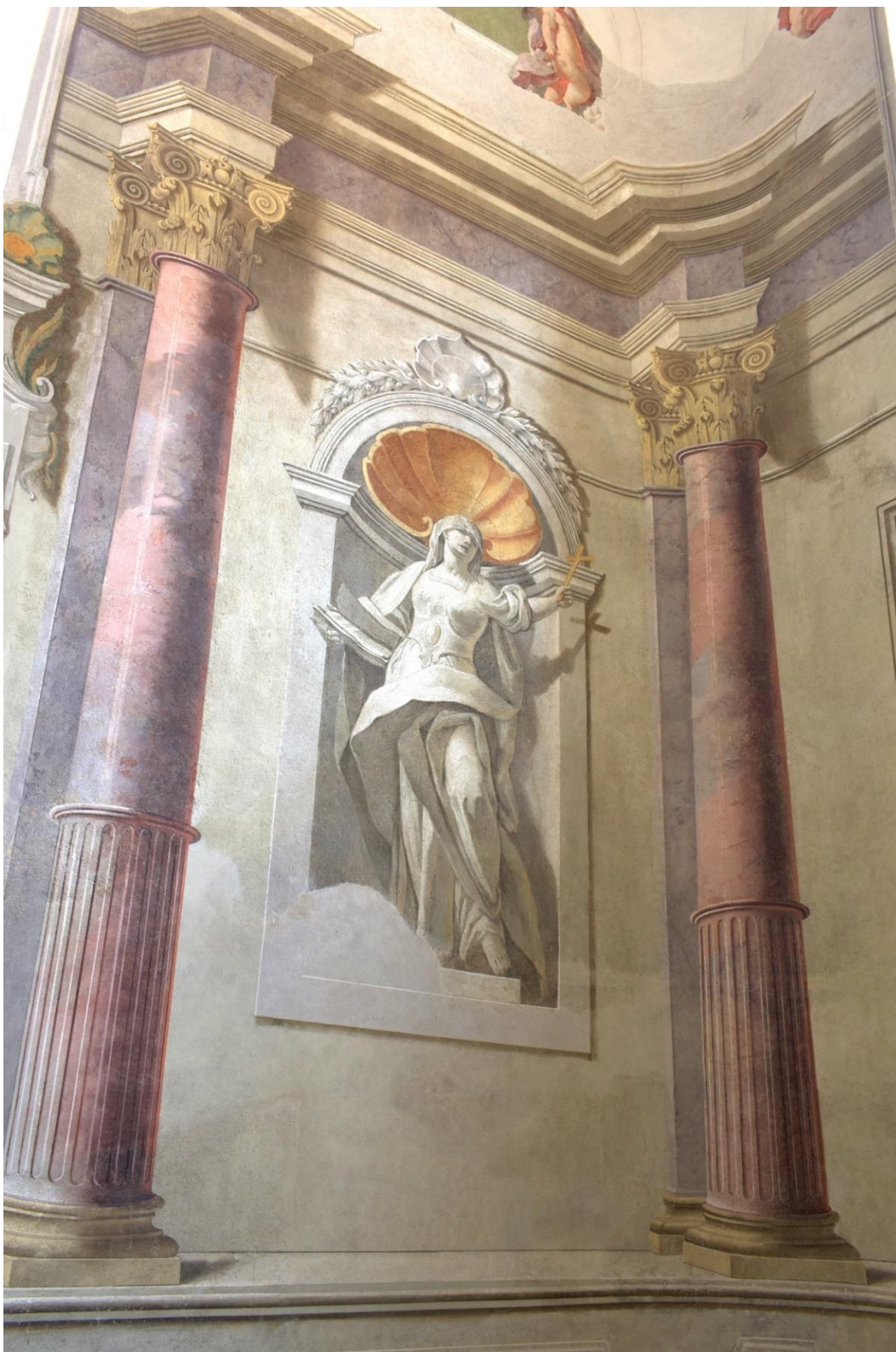
Obrázek 6 Věra s atributem kříže, krásná iluzivní malba, která zachycuje i stín zobrazené postavy