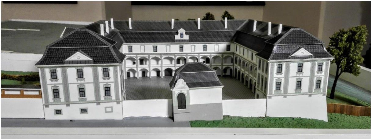
Obrázek 13 Model zámku Žerotínů v barokní době - expozice Zámecké patro