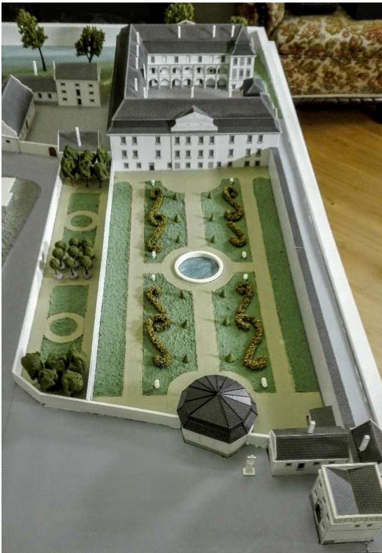
Obrázek 14 Areál zámku s navazující barokní zahradou - expozice Zámecké patro