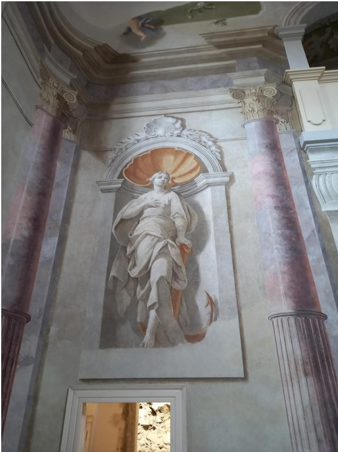
Obrázek 7 Naděje s atributem kotvy, dole vhléd do sakristie kaple, jejíž součástí je i jediný dochovaný zbytek meziříčských hradeb, začleněný při přestavbách do jižního křídla zámku