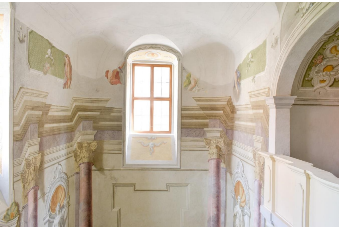
Obrázek 4 Obnovený strop s náčrty původních maleb