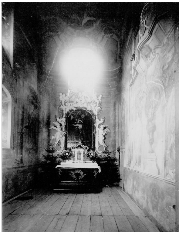
Obrázek 1 Kaple před rokem 1926, než bylo vybudováno schodiště pro potřeby armády