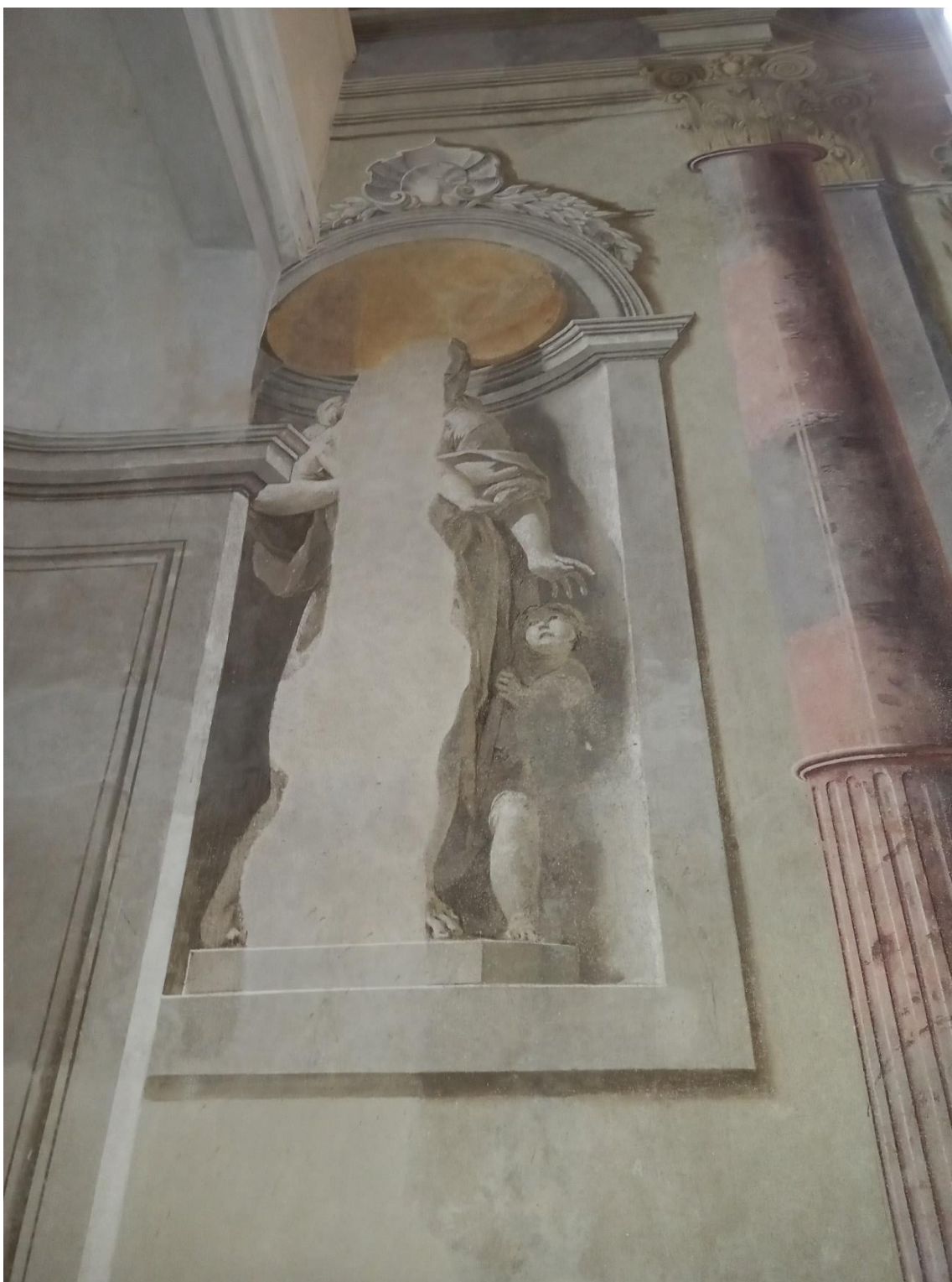
Obrázek 8 Nejvíce poškozená postava Lásky s dětmi, jejíž obličej a značná část těla se bohužel nedochovaly