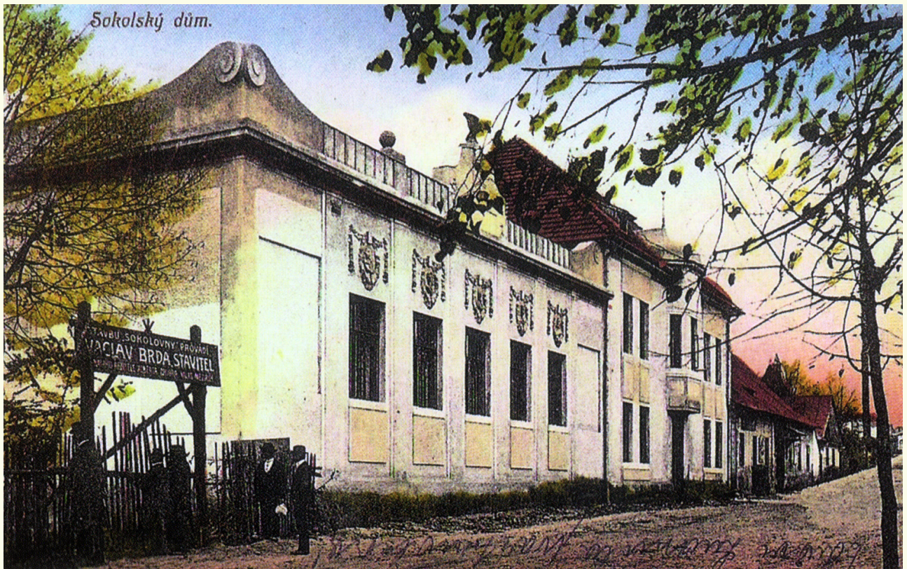
Sokolovna s původní fasádou