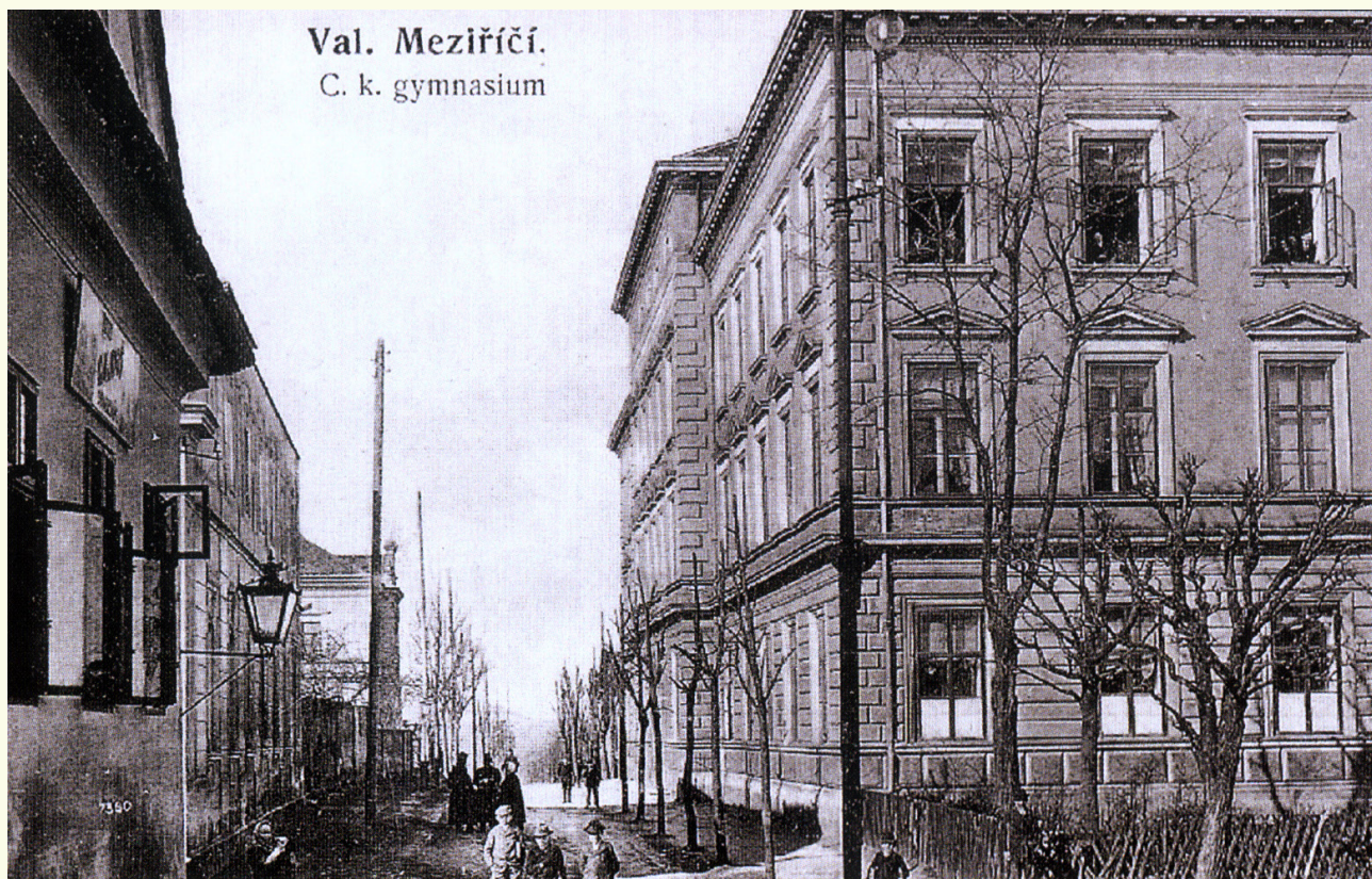
Císařsko-královské státní vyšší gymnázi-