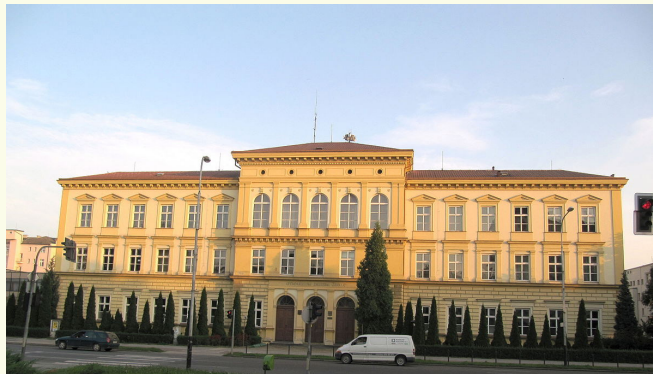
Gymnázium Jakuby Škody v Přerově