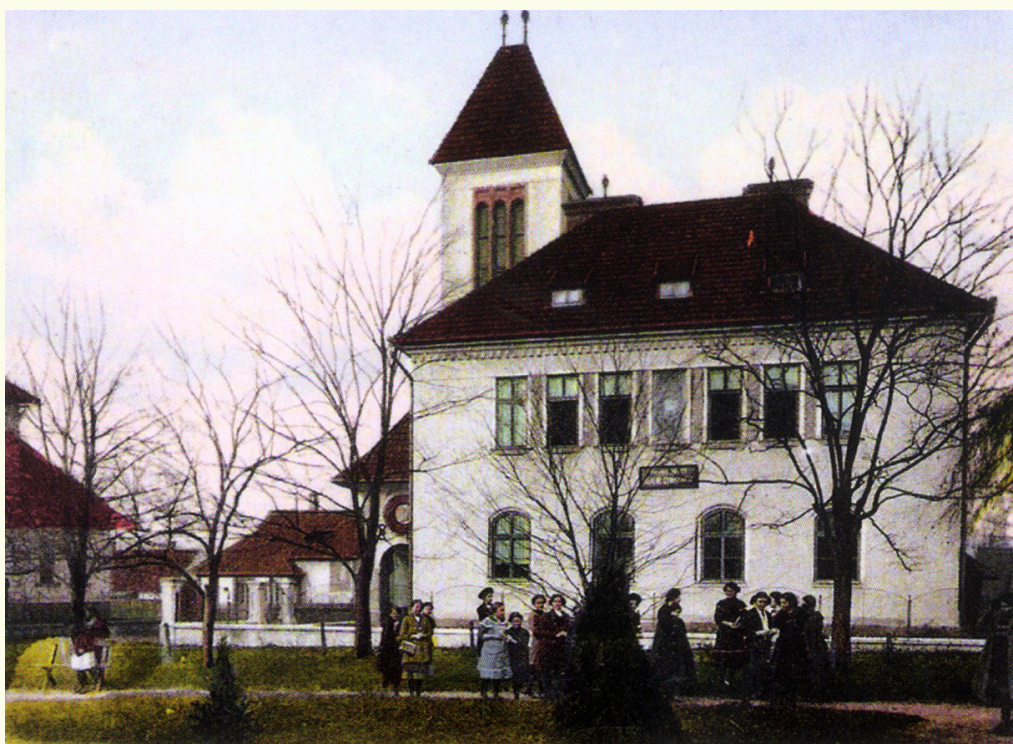
Val. Meziříčí, První dívčí realné gymnásium