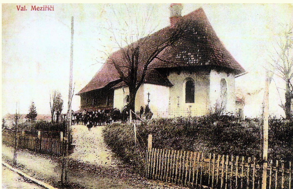
Kostel Největější Trojice, kam chodili gymnazisté na bohoslužby