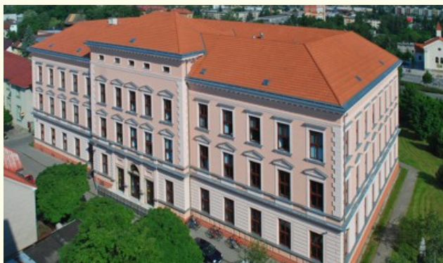
Gymnázium Františka Palackého ve Valašském Meziříčí

Jak sami vidíte, velmi podobné pojetí obou budov se dá jen těžko přehlédnout.