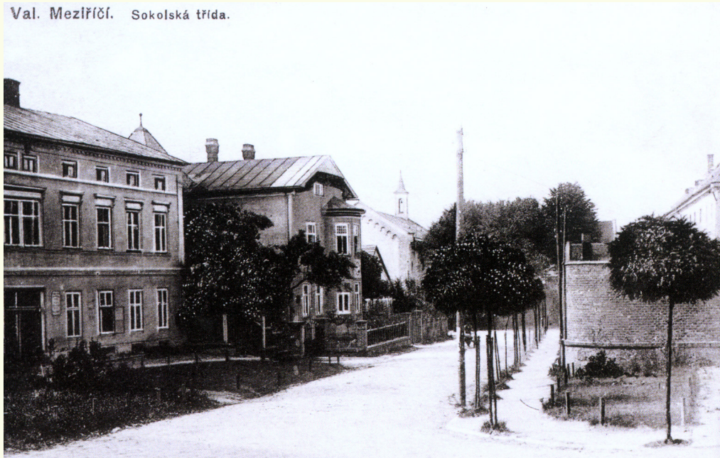
Sokolská ulice úplně jinak, než ji při pohledu od gymnázia známe