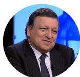
José Manuel Barroso Bývalý předseda Evropské komise

„Díky účasti na předchozích zasedáních EYP mohu potvrdit, že se jedná o opravdu jedinečný zážitek a velice obohacující zkušenost pro mladé lidi, kteří se chtějí dále rozvíjet.“